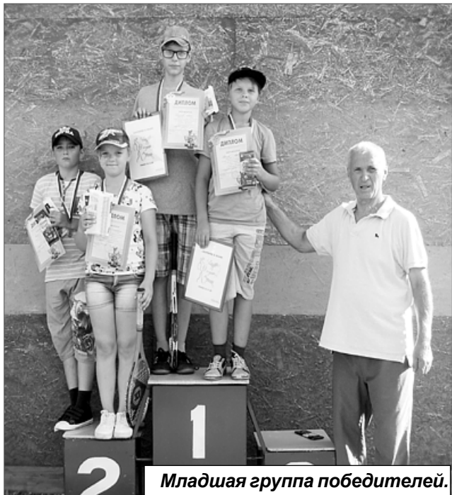
Младшая группа победителей.