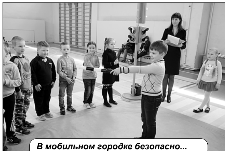
В мобильном городке безопасно...

другие - пешеходов. Главное - не столкнуться.