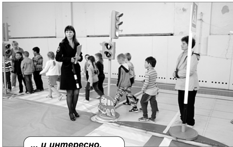
... и интересно.

Но все быстро включились в игру, которая прошла весело и познавательно.