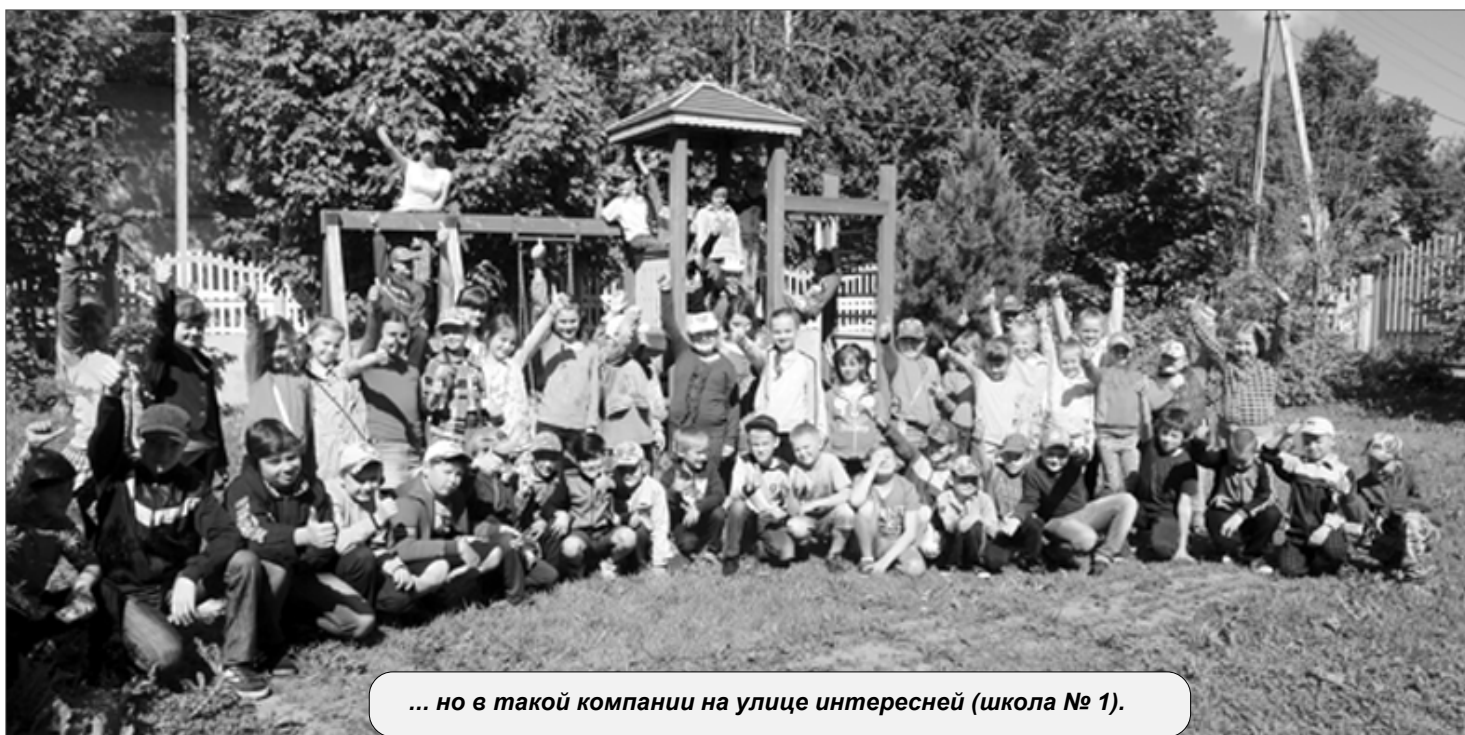
... но в такой компании на улице интересней (школа № 1).