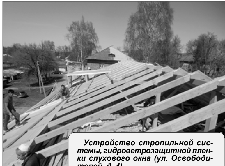
Устройство стропильной системы, гидроветрозащитной пленки слухового окна (ул. Освободителей, д. 4).

Справочно: с июля этого года собственники жилья начнут получать от фонда платежные квитанции с указанием пени за весь период просрочки. Обязанность оплачивать взносы в Фонд капремонта для большинства собственников жилья в многоквартирных домах наступила с 1 октября 2014 года. За весь этот период взносы с должников будут взысканы в полном объеме. Их придется выплатить либо добровольно, либо в принудительном порядке по решению суда. Помимо основной суммы, если будет применена принудительная мера, придется оплачивать и другие расходы, связанные с обращением взыскателя в суд. Деньги немалые: если собственник не платит взносы в течение года, размер выставленной ему пени будет равен величине месячной платы.