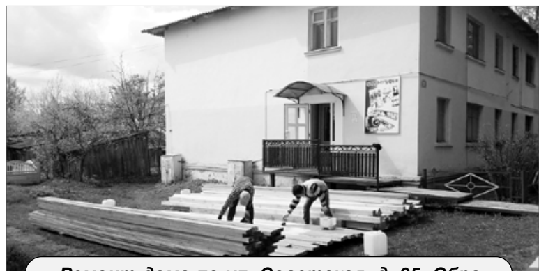
Ремонт дома по ул. Советская, д. 95. Обработка пиломатериалов огнебиозащитным составом.