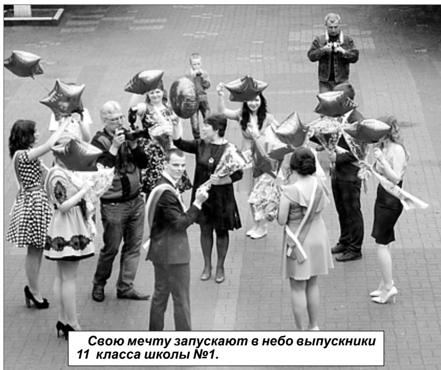
Свою мечту запускают в небо выпускники 11 класса школы №1.

Погода не могла испортить праздника последнего звонка в школах - в нем участвовали не только учителя, ученики и их родители. На линейке во всех школах района с поздравлениями выступили депутаты Районного Собрания, члены политсовета местного отделения Партии «Единая Россия», представители отдела образования. Прозвенел последний звонок, который извещал выпускников о том, что они подходят к финишной черте, что уже не за горами государственные экзамены. Остальным ученикам он сказал приятную вещь, что учебный год подошел к концу и наступила любимая пора - летние каникулы. В этом году род-