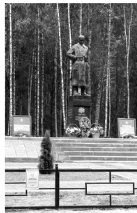
2016 год. Памятник на Гнездиловской высоте после реставрации.