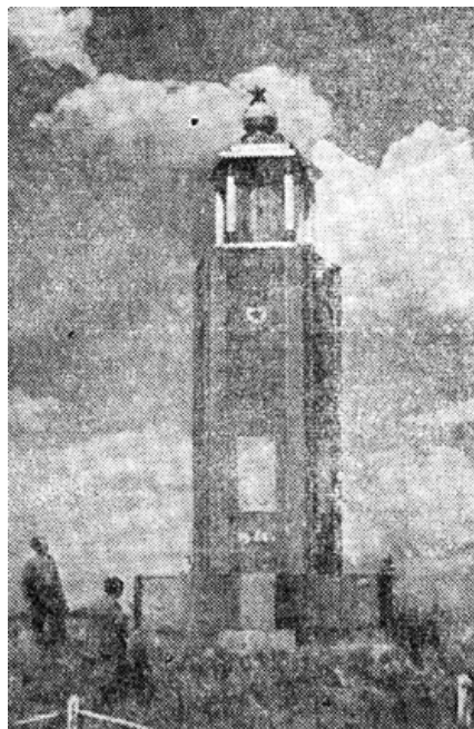
Первый памятник на Гнездиловской высоте.

1.5. Конкурсные работы выполняются индивидуально. Коллективные работы не принимаются.