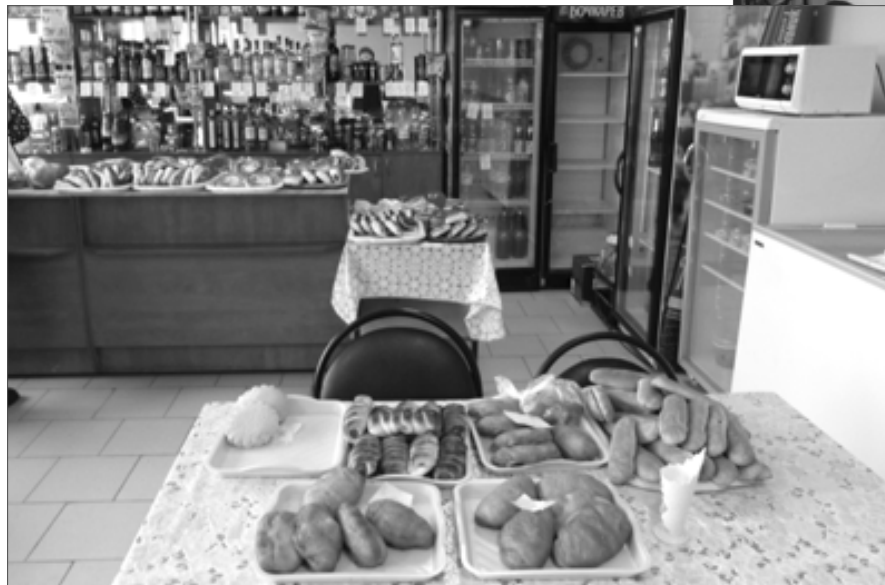
В кафе «Встреча» проведен большой ремонт. Качественное обслуживание клиентов достойно внимания. Не случайно его выбирают для проведения юбилеев, дней рождения, встреч.