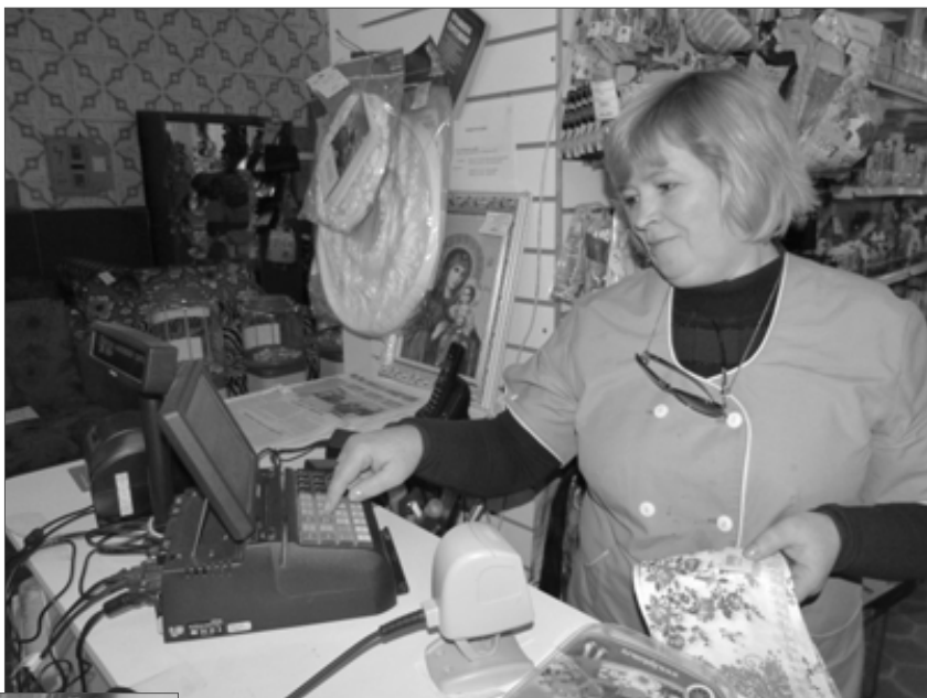
В универмаге действует система автоматизации. Весь товар занесен в компьютер, через него выводят чек на кассу, в нем указаны подробное наименование товара, его цена, количество и сумма к оплате.