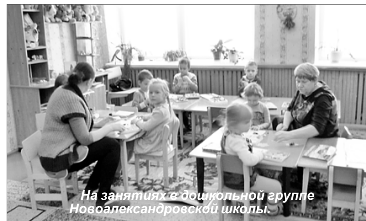
На занятиях в дошкольной группе Новоалександровской школы.

Педагоги подходят к обучению и подготовке к школе каждого ребенка индивидуально. Как и в городском детском саду для сельских ребят имеется все необходимое - методические пособия, книги, игрушки, удобная мебель. Ребята на занятиях мастерят поделки, учат стихи и песни, занимаются физической подготовкой. Для воспитанников предоставляется трехразовое питание. Родительская плата за посещение детского сада составляет 500 рублей в месяц, но, как и в городском детском саду, родителям дошкольников предоставляется компенсация оплаты.