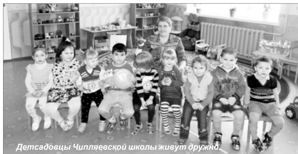
Детсадовцы Чипляевской школы живут дружно

Полосу подготовила Анна ПЕТРОВИЧ при участии специалистов отдела образования администрации МР.