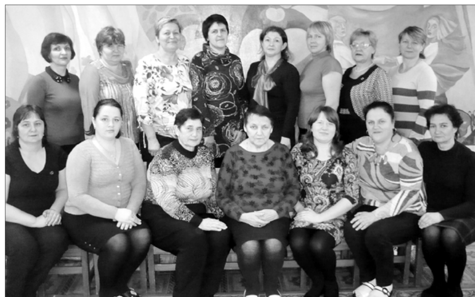
Коллектив детского сада «Рябинка».