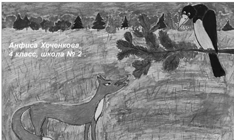
Анфиса Хоченкова, 4 класс, школа № 2.