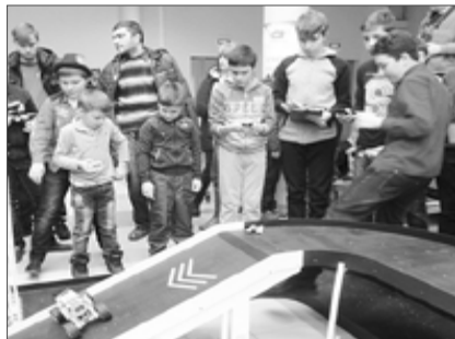
Обучающиеся 8 класса на региональном фестивале робототехники «Роботлига: гонки роботов».