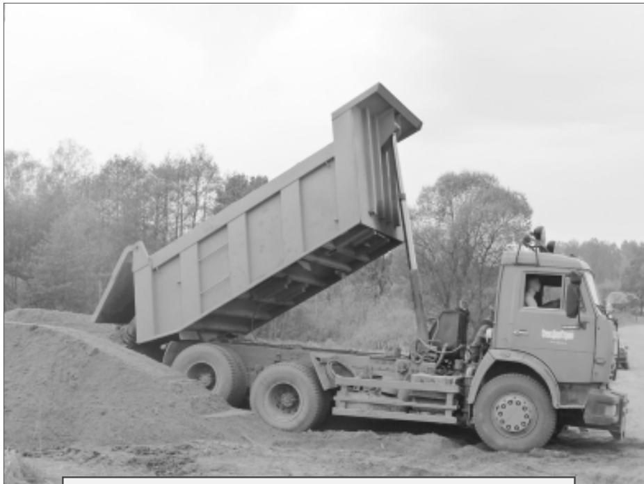
В сентябре машины СпасДорСтроя возили песок для строительства дороги в д. Холмовая.

В сентябре руководство предприятия приняло решение: пока позволяет погода, отремонтировать и запустить завод. Это обеспечит зимние продажи и сделает небольшой задел на будущее. Определились, что будут дробить предварительно заготовленный полуфабрикат. Вот так профессионально выстроенная программа, грамотный подход к делу дают результат. К своему десятилетнему юбилею предприятие подходит с достойными показателями.