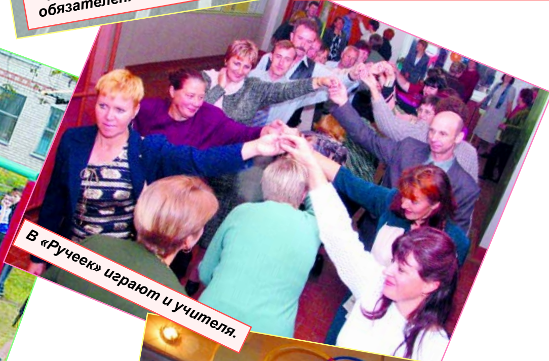
В «Ручеек» играют и учителя.