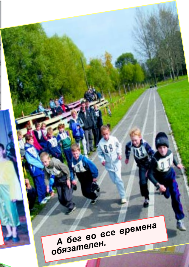
А бег во все времена обязателен.