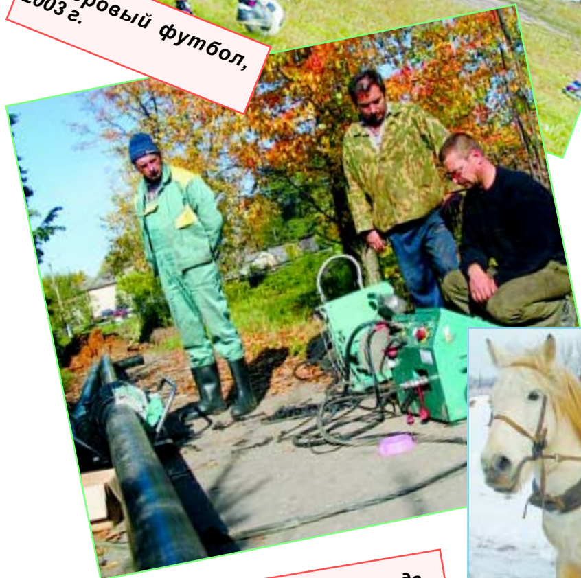
Начало газификации города. Как тут разобраться?