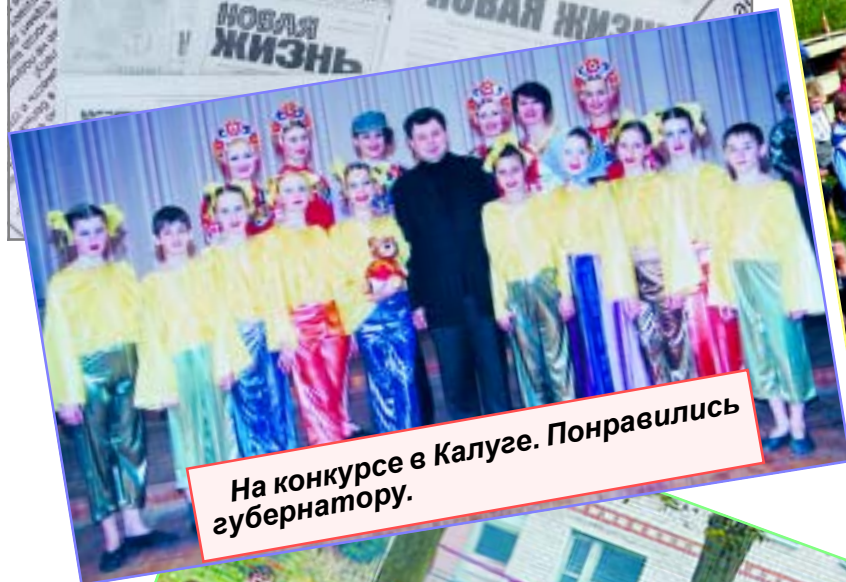
На конкурсе в Калуге. Понравились губернатору.