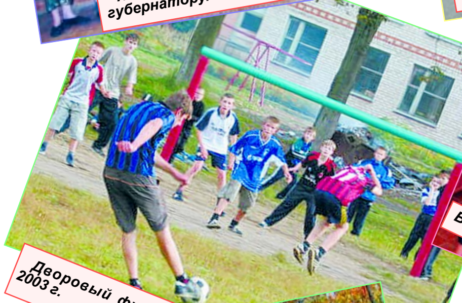
Дворовый футбол, 2003 г.