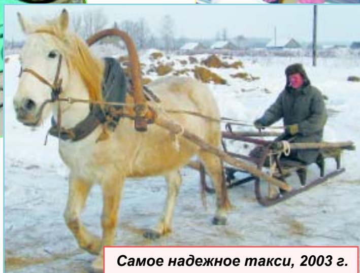
Самое надежное такси, 2003 г.