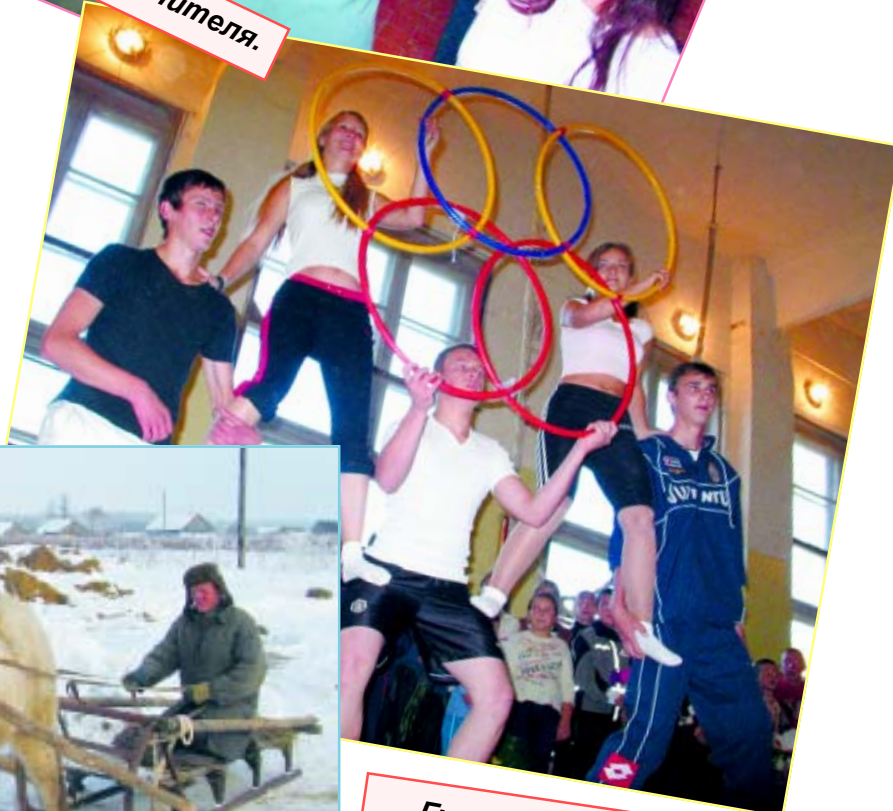
Гимнастические номера собирали много болельщиков.