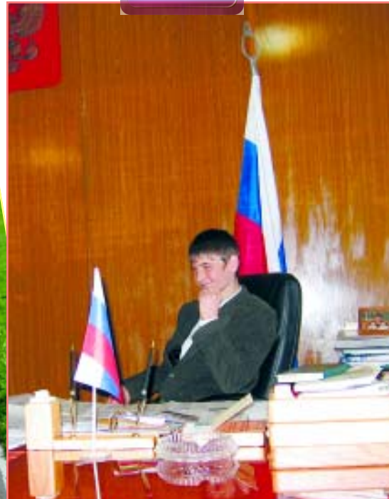
Плох тот школьник, который не мечтает стать... главой администрации.