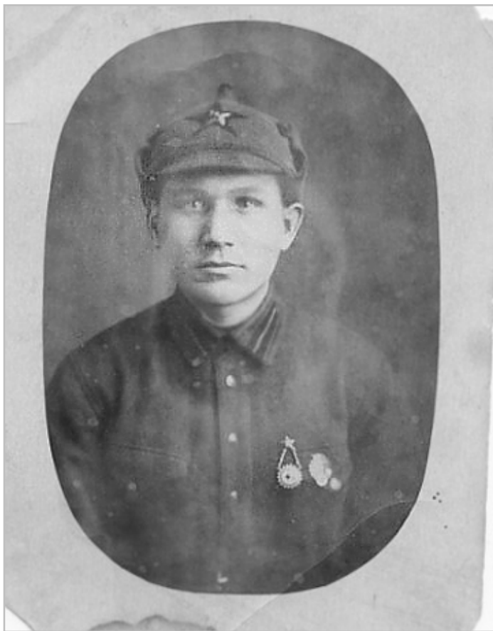
Семейная реликвия - фотография отца, сделанная в 1936 году, когда он был на срочной службе.

В Спас-Деменском районе увековечили имя погибшего воина из Коми округа