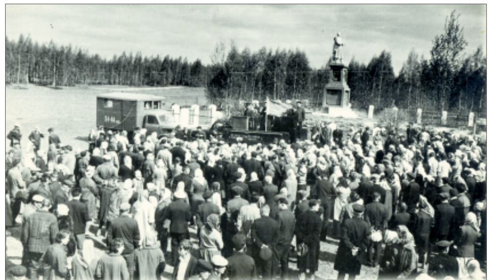
Такой была Гнездиловская высота в 1967 году. На снимке: митинг в честь слета партизанских отрядов.

В преддверии 73-й годовщины освобождения района при поддержке власти и Российского военно-патриотического общества проведена реконструкция мемориала. Установлены новые пилоны с фамилиями погибших и памятник, баннеры, рассказывающие об этом месте, выложены дорожки и площадки, облагорожена территория вокруг и четыре братских захоронения. На протяжении месяца здесь трудились ежедневно от 10 до 20 человек и техника, спеша закончить работы к назначенному дню, приезжали на субботники трудовые коллективы и жители.