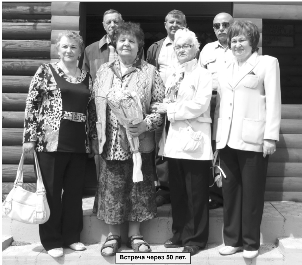
Встреча через 50 лет.

Министерство внутренней политики и массовых коммуникаций Калужской области. Информация доступна на сайте областной администрации: www.admobkaluga.ru .