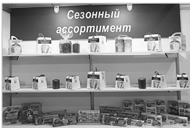
Стенд фабрики «Хлебный Спас» на Международной выставке «ПРОДЭКСПО».

Особенно заметна ее роль в поддержке спорта. Команда КФ участвует в соревнованиях по разным видам спорта. А сладкие призы «Хлебного Спаса» вручаются победителям и всем участникам турниров. Не стали исключением детский велокросс и легкоатлетическая эстафета в честь Дня Победы. В тот день никто не ушел без подарка с маркой «Хлебный Спас».