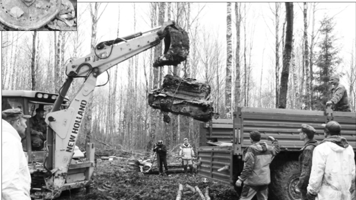
И снова в воздух... Только теперь путь героического «летающего танка» Великой Отечественной не в бескрайнее небо, а в музей - таков его полет из рокового 1943-го в мирный 2016-й. Это полет памяти.