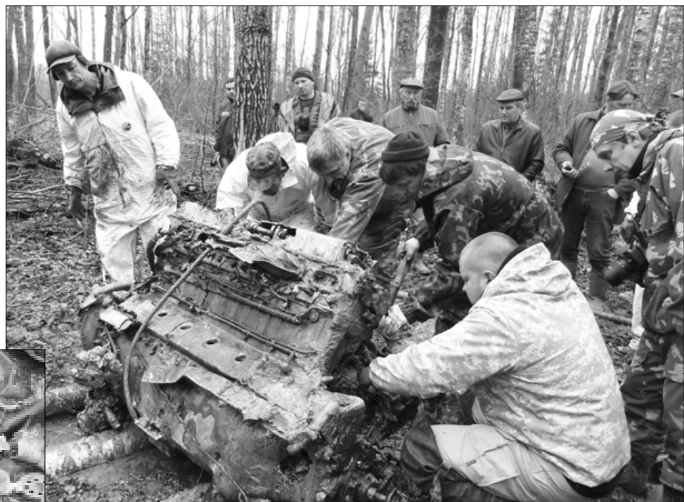
Участники подъема самолета старательно очищали двигатель от налипшей глины в надежде обнаружить номер...