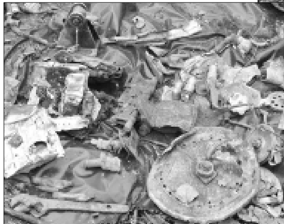
Собраны даже самые мелкие фрагменты самолета.

Благодаря поисковикам мы узнали о том, что не только на земле, но и в воздухе шел жестокий бой с врагом. Штурмовики, работая на малых высотах, с большой точностью уничтожали объекты и живую силу противника. Фашисты прозвали ИЛ-2 «черной смертью». Но не каждому экипажу удалось вернуться из боя. Под деревней Соболи оборвались