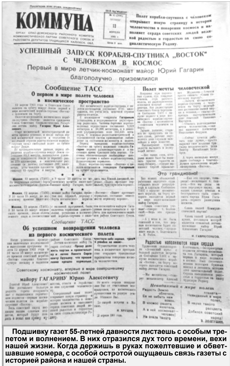
Подшивку газет 55-летней давности листаешь с особым трепетом и волнением. В них отразился дух того времени, вехи нашей жизни. Когда держишь в руках пожелтевшие и обветшавшие номера, с особой остротой ощущаешь связь газеты с историей района и нашей страны.

А вот эта небольшая заметка созвучна и нашим дням: «Как только над городом опускаются сумерки, некоторые улицы погружаются в кромешную тьму. Лампочки перегорели, а новыми их не заменили. Городскому Совету следует обратить на это внимание и навести порядок с освещением улиц».