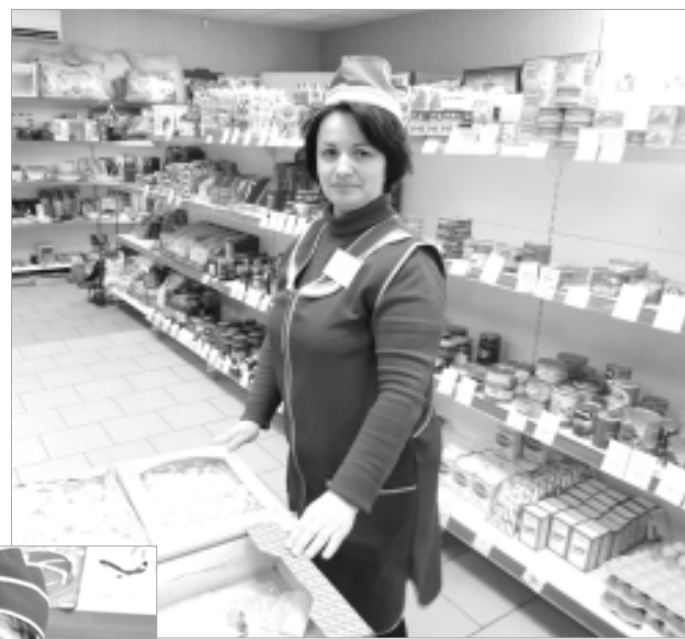
Коллектив магазина самообслуживания с. Чипляево успешно справляется с выполнением плановых заданий.

✓ Объем заготовительного оборота - 22 млн. рублей.