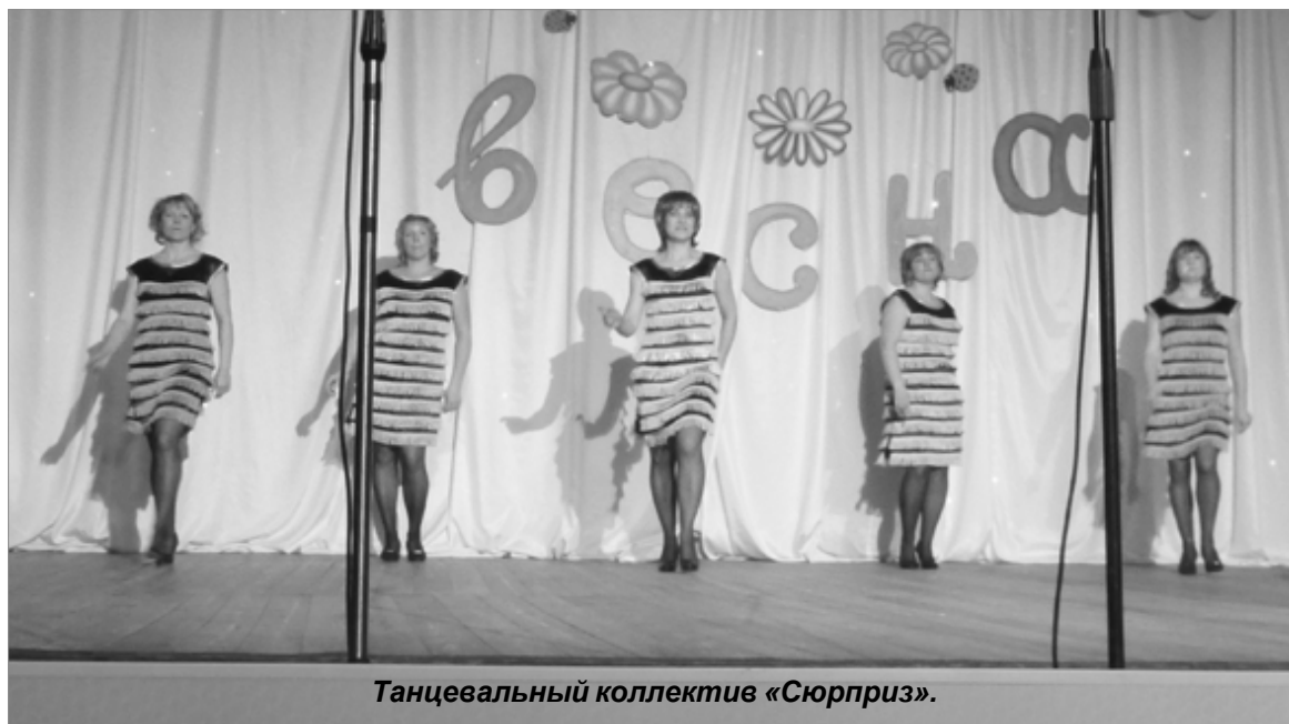
Танцевальный коллектив «Сюрприз».

8 Марта - праздник любви и восхищения женщинами, самыми прекрасными созданиями на земле. Изначально праздник имел чисто политическую окраску и был днем борьбы женщин за равенство в обществе. Но время стерло с него всю политическую подоплеку, оставив в нашем календаре этот день именно тем, чем мы сегодня его и представляем - весенним праздником женственности, которую так ярко продемонстрировали участницы районного конкурса «Женщина-весна».