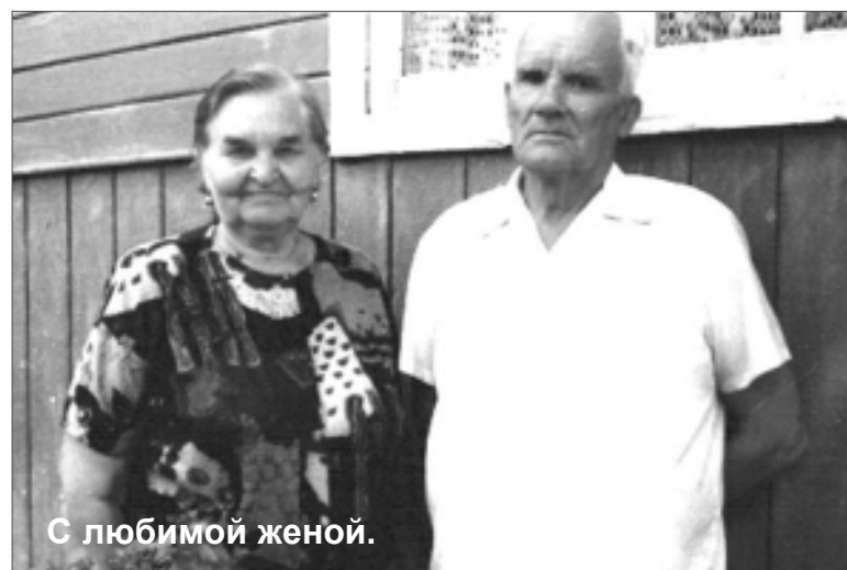
С любимой женой.

дням. - В октябре 1944 года преодолели границу с Восточной Пруссией. Немцы отчаянно сопротивлялись, поэтому с ожесточенными боями продвигались вперед лишь на два километра. 13 января, по просьбе союзников, пошел в наступление 3-й Белорусский фронт, прорвав оборону противника.