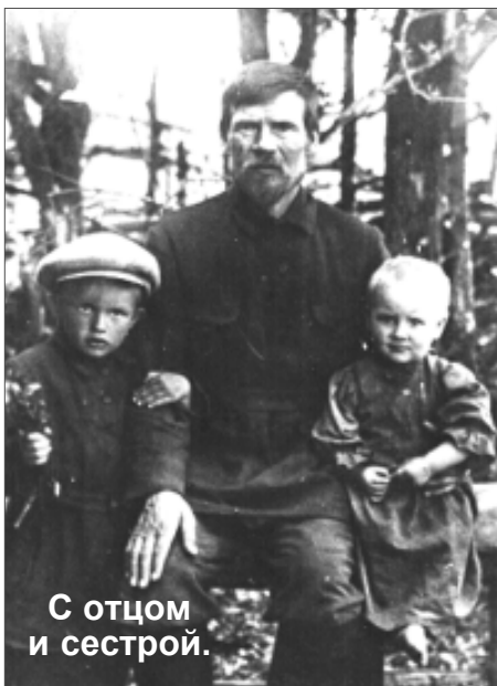
С отцом и сестрой.

В августе 1943 года немцы выгнали всех жителей из домов и погнали в сторону Рославля. Несколько дней держали в лагере для пленных, потом отправили в Шумяцкий