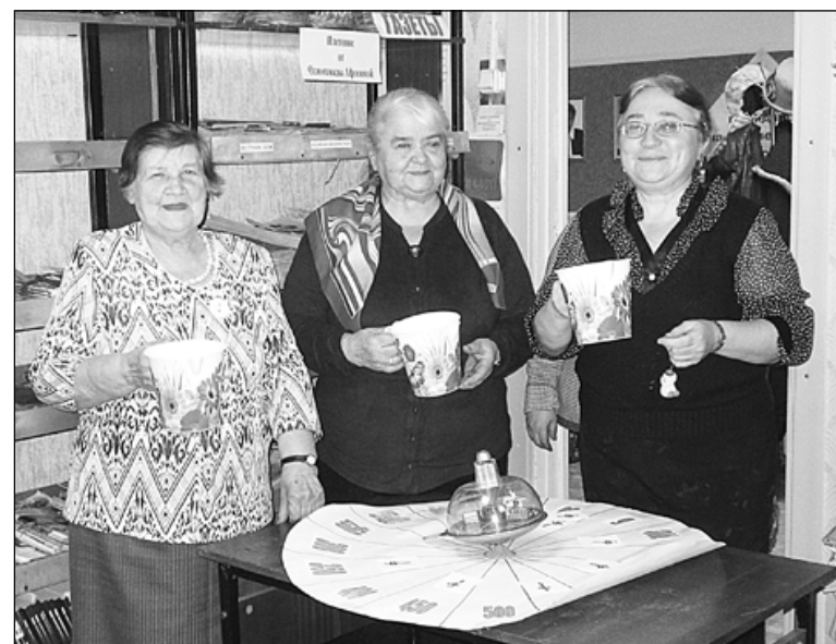
На снимке: урожайное на призы «Поле чудес» в библиотеке.

Поле чудес каждый представляет по своему. Кто-то мечтает о несметном богатстве, кто-то об удаче. Но у тех, кто получает радость от труда на своем участке, чудеса случаются гораздо чаще – они в первом пробившемся ростке, зародившейся яголке и в банках, наполняющих кладовые.