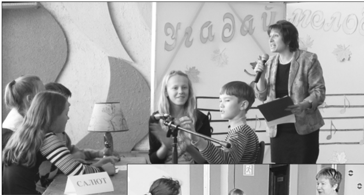
«Катюшу» знают и поют все.

Каждая встреча с детьми проходит при участии членов клуба