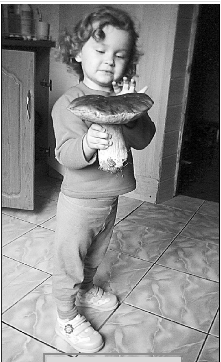
Вот такой грибок у папы в кузовке нашла!