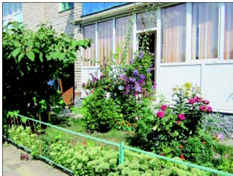
Переулок Школьный, д. 11.