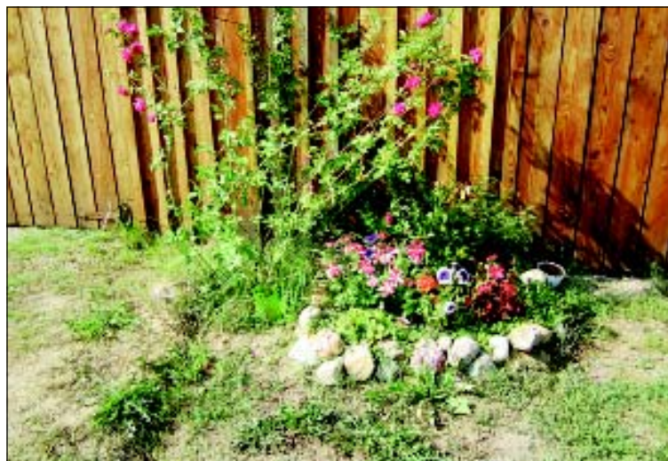
Ул. Советская, д. 130.