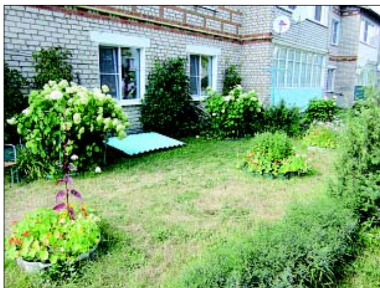
Ул. Советская, д. 16 «а».