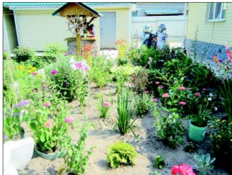
Ул. Садовая, д. 4.