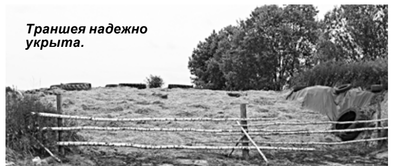
Траншея надежно укрыта.

Пример ЗАО «Истоки» подтверждает, что учиться можно не только на своих ошибках, но нужно брать на вооружение и положительный опыт, применяя то, что дает хороший результат. Кормозаготовительную кампанию здесь ежегодно начинают с закладки силоса. В траншею трамбуют многокомпонентную смесь: клевер, люцерну, многолетние травы, специально посеянную на корм рожь, разнотравье. Получается этаким салатом, который благодаря строгому соблюдению технологии приготовления отвечает всем требованиям по качеству.