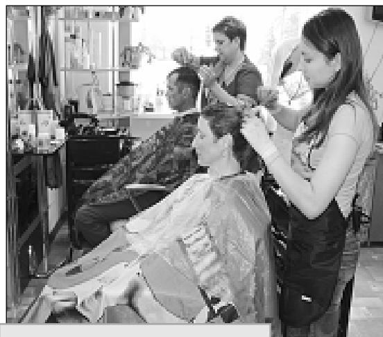
В салоне «Кристина».

День российского предпринимателя - один из праздников современной России. Он был учрежден в 2007 году указом президента РФ Владимира Путина. Сейчас, во времена рыночной экономики, государство стремится делать ставку на малый бизнес как на силу, способную помочь государству выйти из кризиса, так как предпринимательством занимаются инициативные люди, способные всю ответственность за ведение бизнеса взять на себя. Их деятельность является важным элементом рыночной экономики, без которого не может гармонично развиваться государство.