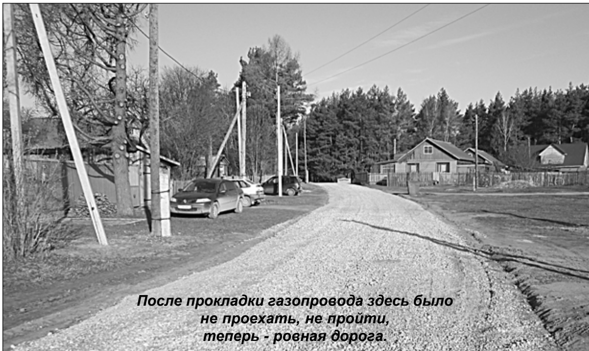
После прокладки газопровода здесь было не проехать, не пройти, теперь - ровная дорога.

Министерство внутренней политики и массовых коммуникаций области.