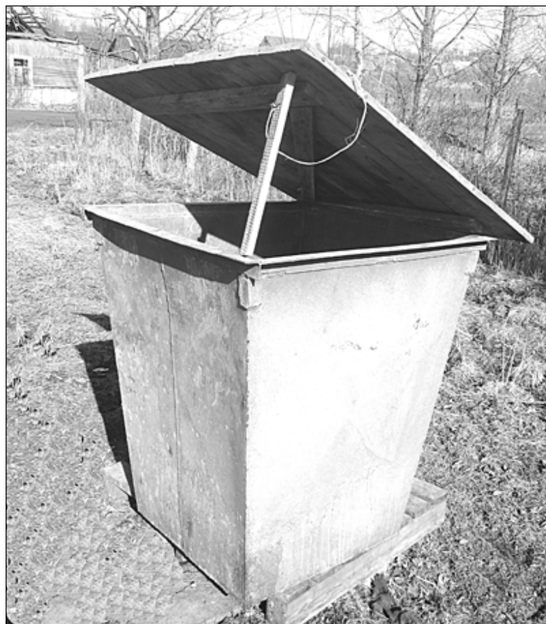
На снимке: жители улицы Ленина позаботились о контейнерах.

подставку. В таком виде он прослужит гораздо дольше. В связи с этим хотелось бы обратиться к руководству МУП «Благоустройство» с предложением. Оборудовать везде огражденные площадки у предприятия возможностей нет, но установить контейнеры на подставки можно. На территории полно поддонов от тротуарной плитки, нужно только развезти их по улицам на места сбора мусора. Вот это будет по-хозяйски.