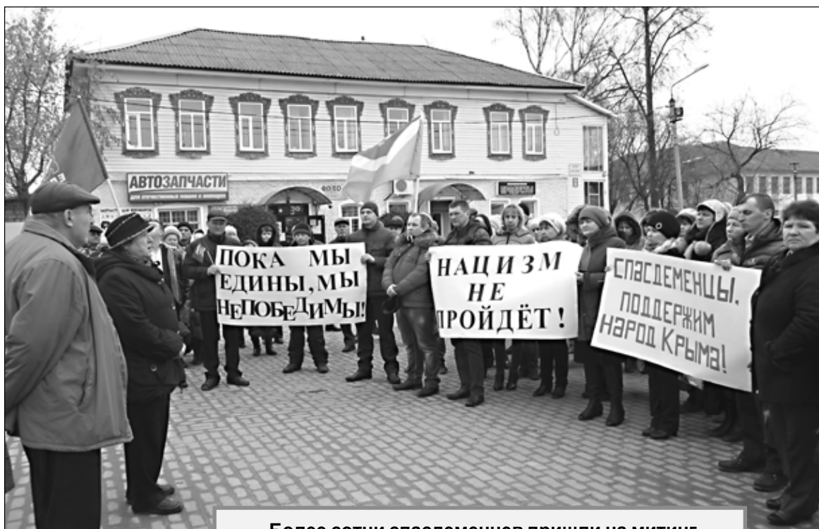
Более сотни спасдеменцев пришли на митинг в поддержку народа Украины.