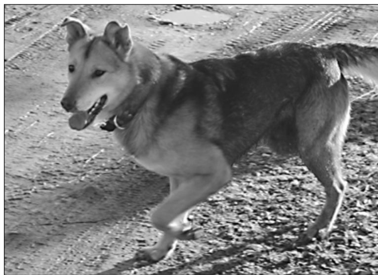
Собаке - прогулка, хозяину - штраф 5 тысяч рублей.