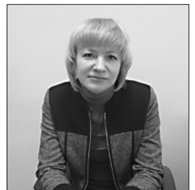
«Тепло - удовольствие недешевое».

ры, которые выбрали направление развития молочного скотоводства, позволяющее повысить продуктивность стада, снизить трудозатраты и себестоимость продукции. Таким хозяйствам окажут помощь в создании роботизированных ферм.