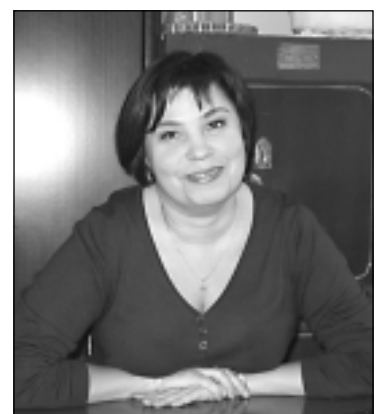
«Забота о детях и пожилых людях - показатель благополучия муниципалитета».