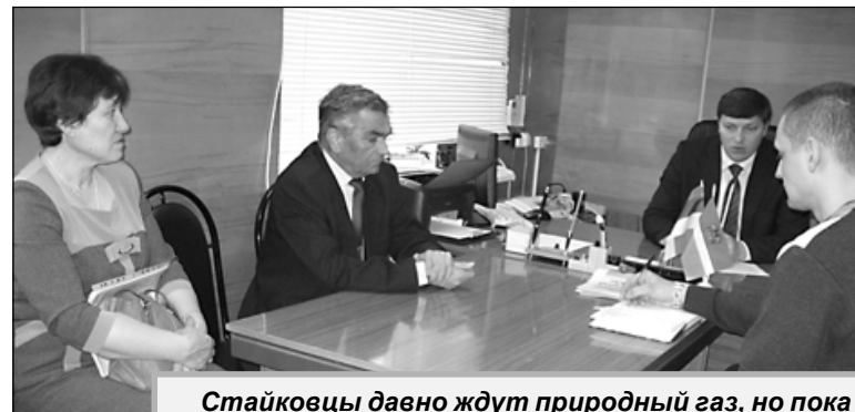
Стайковцы давно ждут природный газ, но пока и с баллонным у них проблемы.