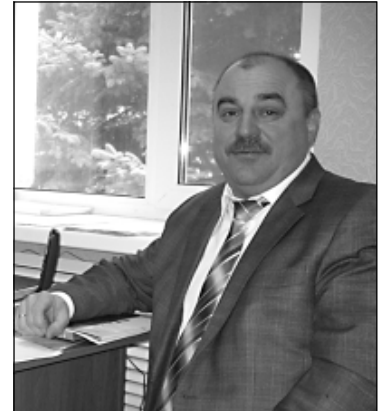
«В Спас-Деменском районе с экологией все в порядке».