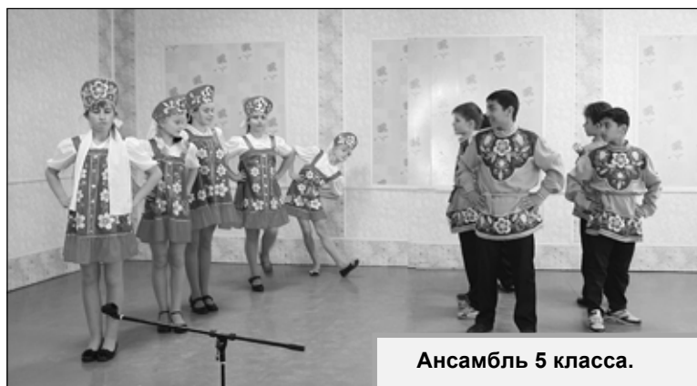
Ансамбль 5 класса.