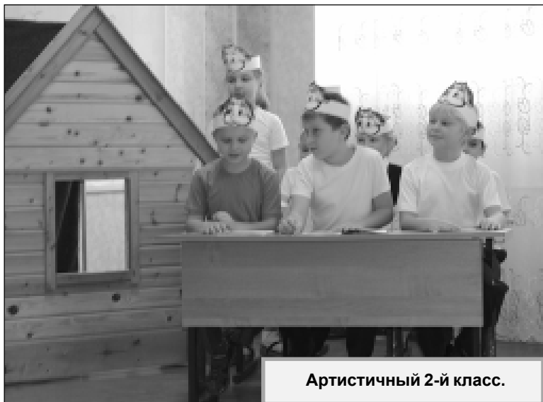
Артистичный 2-й класс.