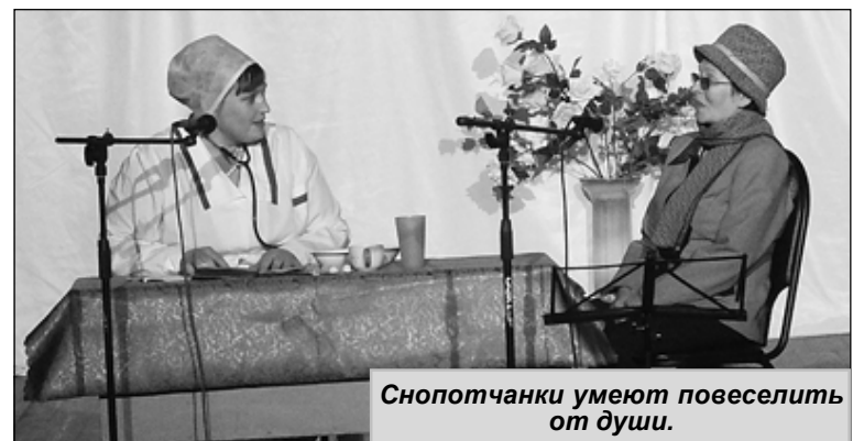
Снопотчанки умеют повеселить от души.