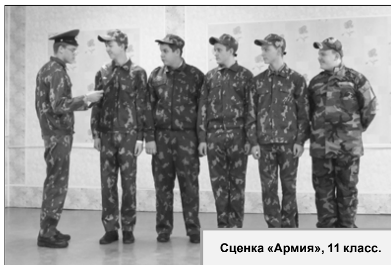
Сценка «Армия», 11 класс.