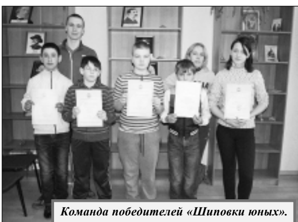
Команда победителей «Шиповки юных».