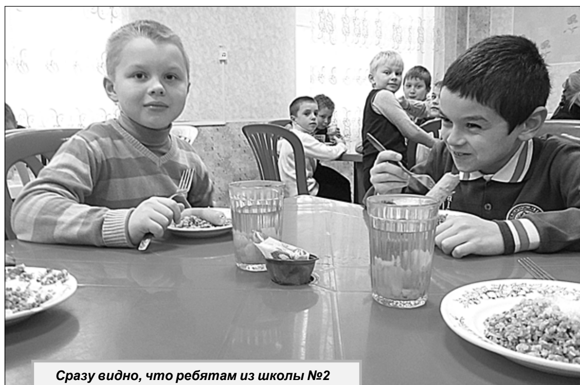
Сразу видно, что ребятам из школы №2 завтрак пришелся по вкусу.