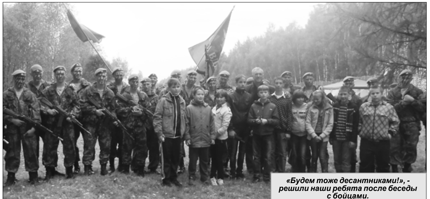
«Будем тоже десантниками!», – решили наши ребята после беседы с бойцами.