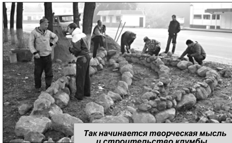
Так начинается творческая мысль и строительство клумбы...