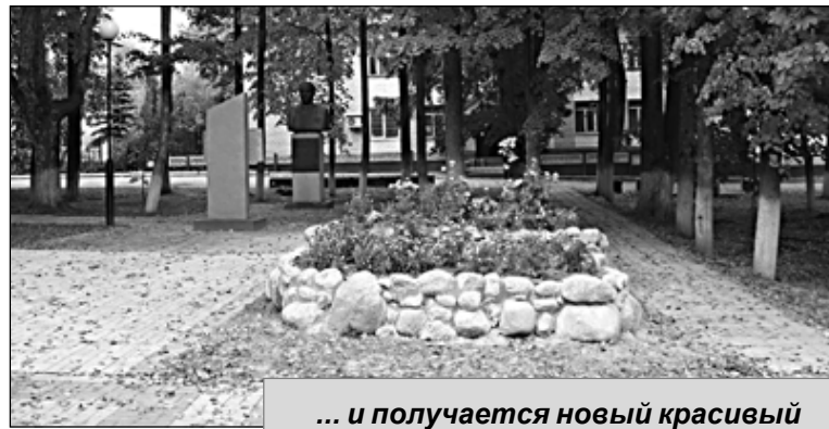
... и получается новый красивый уголок отдыха.

ство» завезли песок и валуны из спас-деменского карьера.