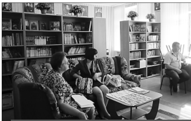
В библиотеке Новоалександровской школы. Комиссия отметила комфорт, эстетику оформления и высокую техническую оснащенность новых школьных библиотек.

Отмечены хорошее благоустройство территорий, аккуратность в пользовании имуще-