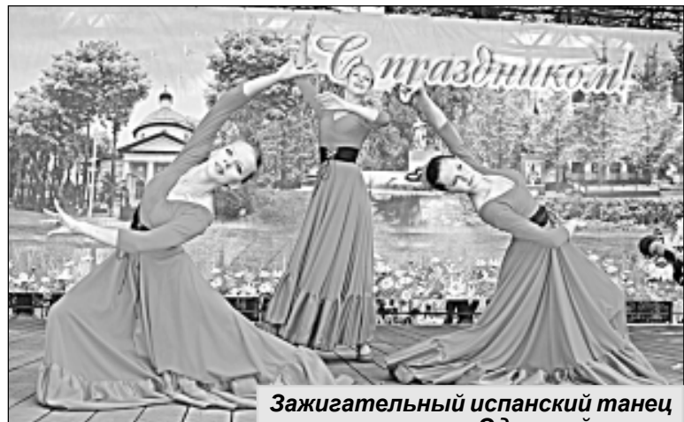
Зажигательный испанский танец коллектива «Эдельвейс».

Материалы с фестиваля подготовил Виталий ЛЫСЕНКОВ.