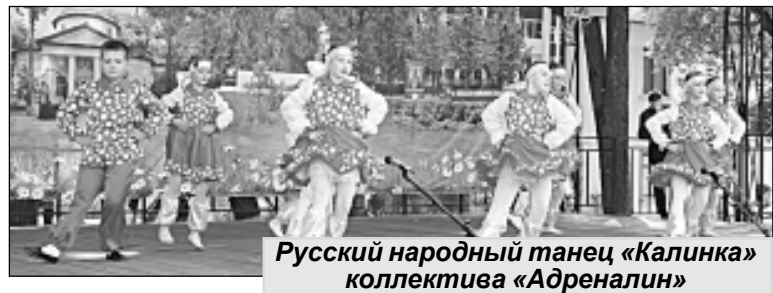
Русский народный танец «Калинка» коллектива «Адреналин»