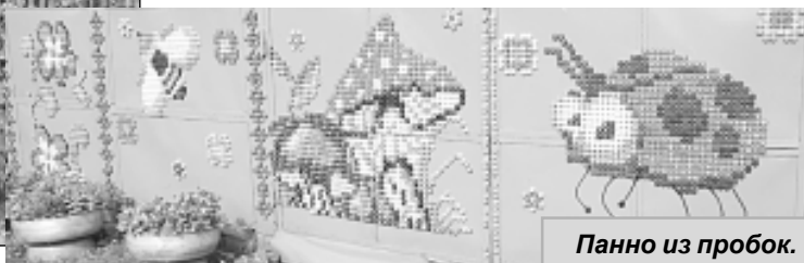
Панно из пробок.