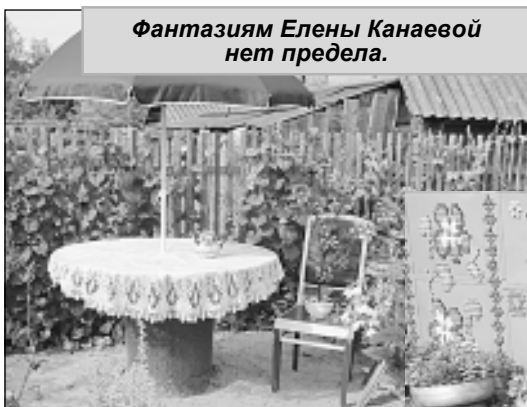
Фантазиям Елены Канаевой нет предела.