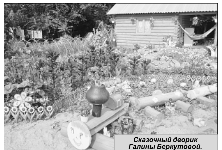
Сказочный дворик Галины Беркутовой.

На улице Железнодорожная к нам подошли жители и на все лады стали расхваливать своих