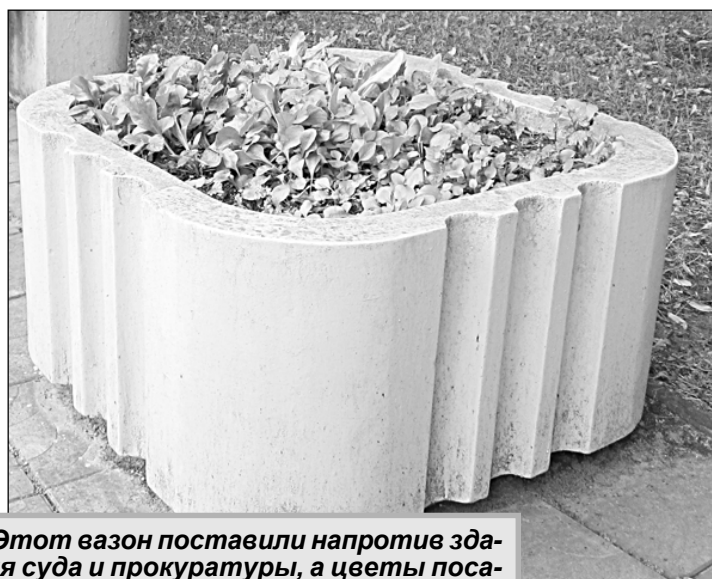
Этот вазон поставили напротив здания суда и прокуратуры, а цветы посадить забыли, одна трава.