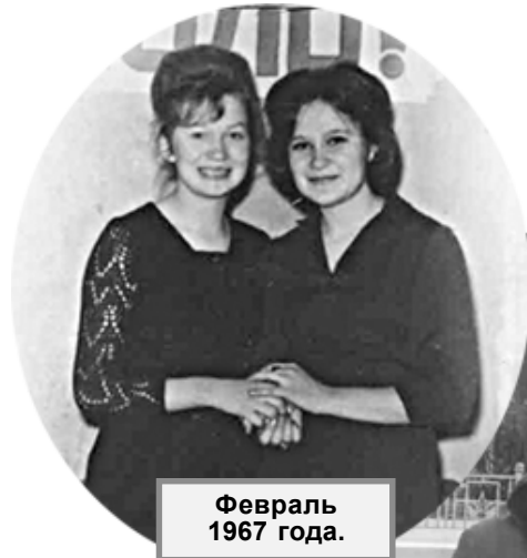
Февраль 1967 года.

Говорят, что сейчас готовится к изданию единый учебник истории, а я вспоминаю 90-е годы, когда начались в экономике рыночные отношения. Никто не знал, что это такое, учебников вообще не было, никаких пособий и задачников тоже. Стране были нужны специалисты нового формата, лекции и практические занятия было трудно проводить, чем могло, помогало министерство, но в основном «крутились» сами, как могли, по переводным западным и