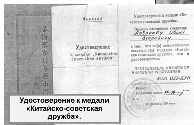
Удостоверение к медали «Китайско-советская дружба».

человеком, и куда бы его ни направляли работать – директором молокозавода или возглавлять коллектив хлебокомбината – трудился с полной отдачей, вел активную общественную деятельность, имел много грамот и благодарностей, был отличным семьянином, очень любил маму, своих детей и внуков. Умер он 8 января 1990 года, похоронен в Спас-Деменске, там же упокоилась спустя 12 лет и мама. Печали и радости по жизни, обнявшись, идут. Эти могилки, как путеводные звезды. В связи с этим не могу не вспом-