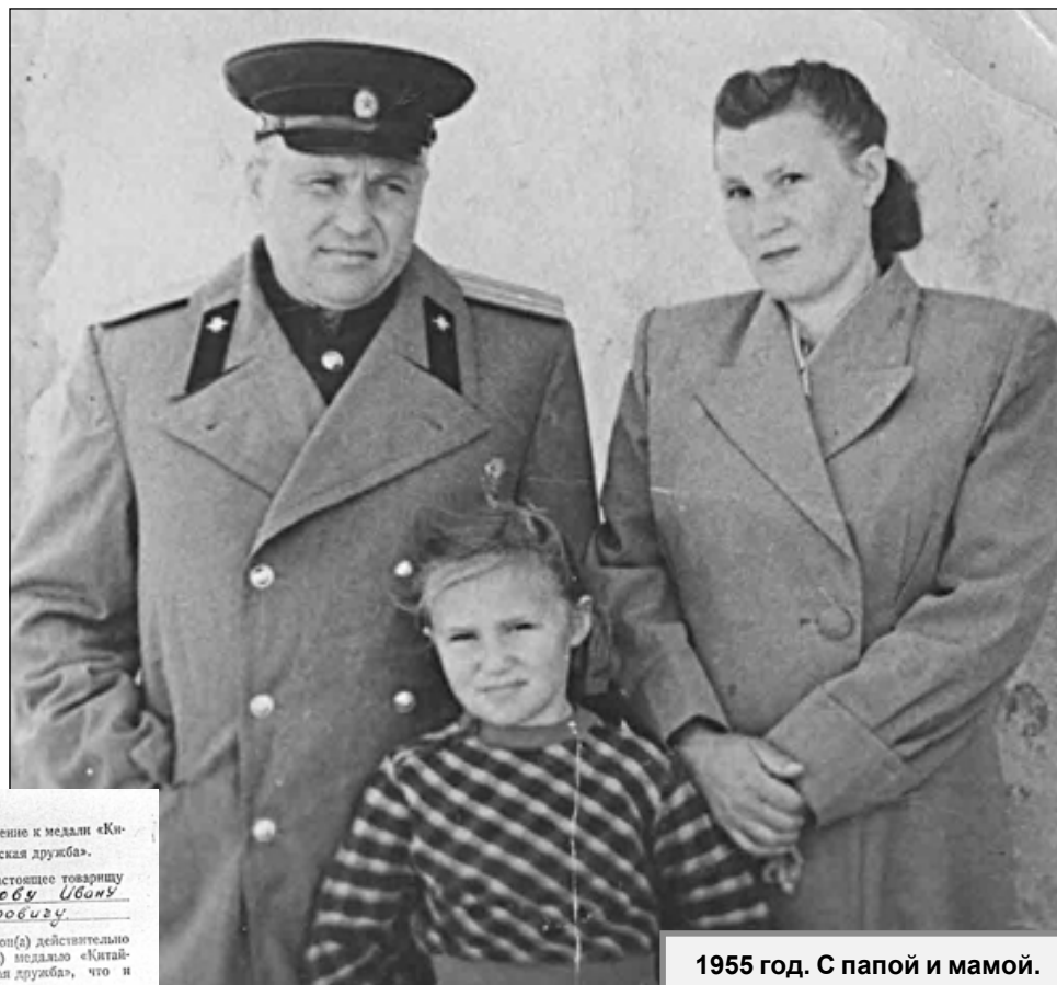
1955 год. С папой и мамой.

По приезду в Спас-Деменск мама начала обустройство наш быт, меня воспитывала строго, я боялась ее обидеть или сделать что-то не так, но всегда могла все