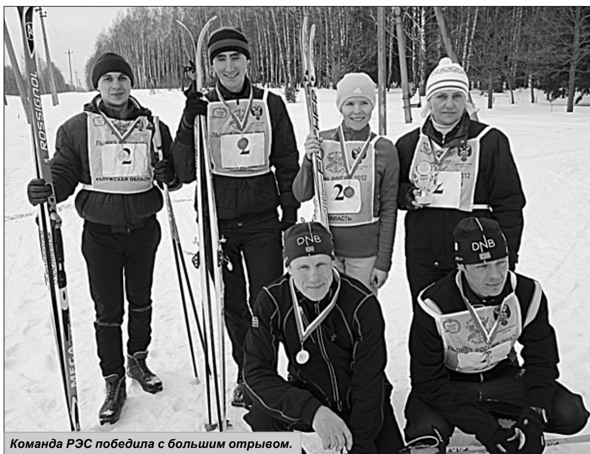
Команда РЭС победила с большим отрывом.