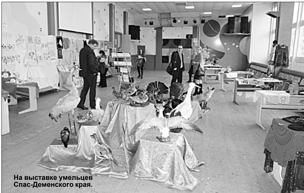
На выставке умельцев Спас-Деменского края.

Валентина ФИТИСОВА.