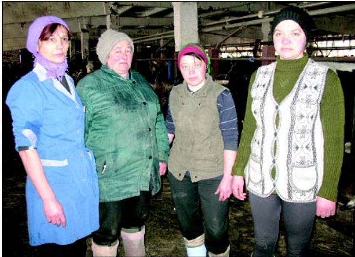
На снимке: «На нашей ферме все в порядке!» - заверили животноводы ЗАО «Истоки».

Нет проблем со сбытом продукции. Молоко отправляют на местный мини-завод. Масло, творог, сметана из стайковского молока пользуются спросом в районе и за его пределами.