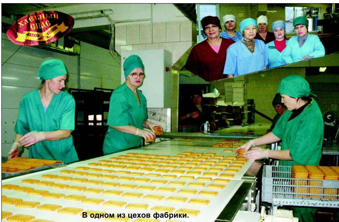
В одном из цехов фабрики.

Постановление администрации муниципального района «Спас-Деменский район» от 05.02.2013 г. № 52