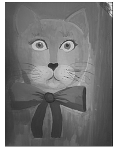
Кошка Сима - первая красавица во дворе. Рисунки Полины ФИТИСОВОЙ.

На флоте много разных работ, Но поваром работал кот. Слава ВОЛОВ.