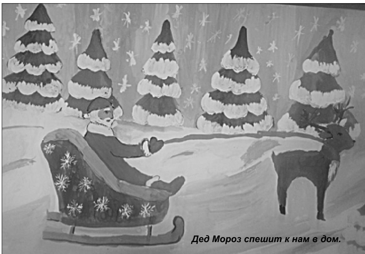
Дед Мороз спешит к нам в дом.