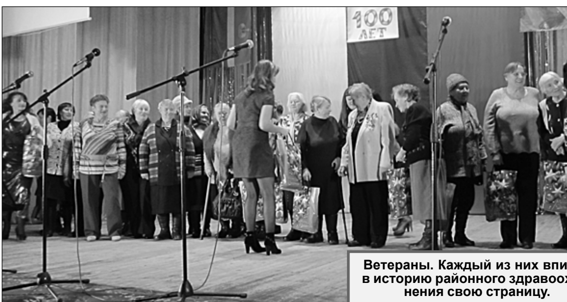
Ветераны. Каждый из них вписал в историю районного здравоохранения свою страницу.