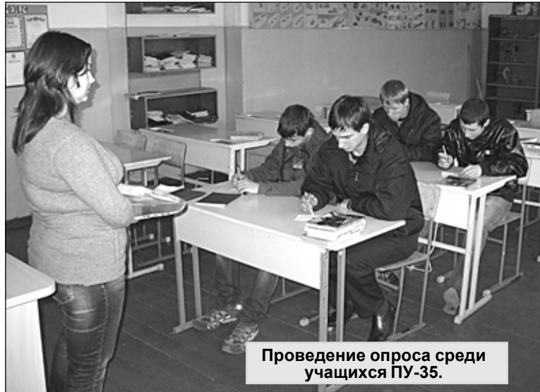
Проведение опроса среди учащихся ПУ-35.

100 процентов опрошенных старшего поколения уверенно называют официальное название праздника. Преобладающее большинство молодежи также дают ответ: «День народного единства», но встречаются также ответы: «День России»,