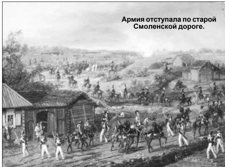
Армия отступала по старой Смоленской дороге.