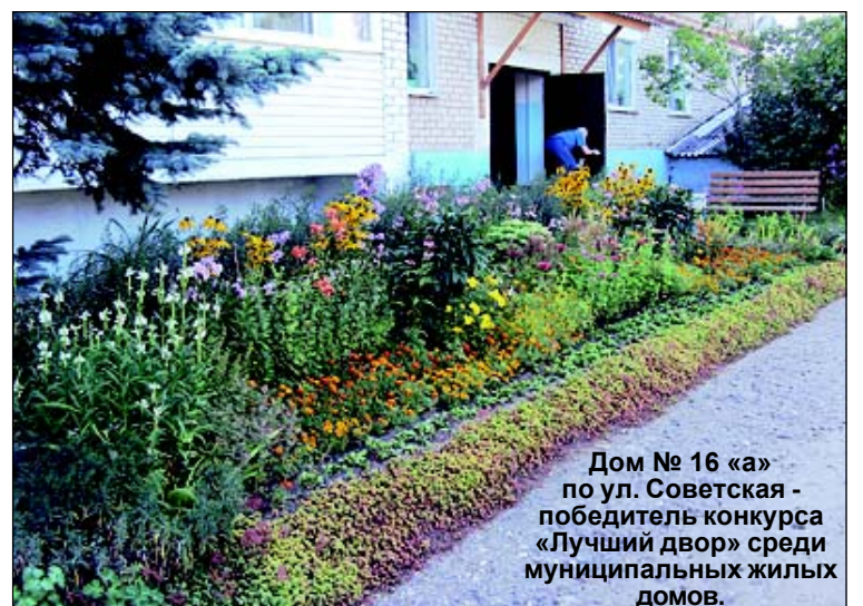
Дом № 16 «а» по ул. Советская - победитель конкурса «Лучший двор» среди муниципальных жилых домов.

Руководствуясь постановлением администрации городского поселения «Город Спас-Деменск» от 13.06.2012 года №70 «О проведении конкурса» и на основании протокола заседания комиссии по подве-