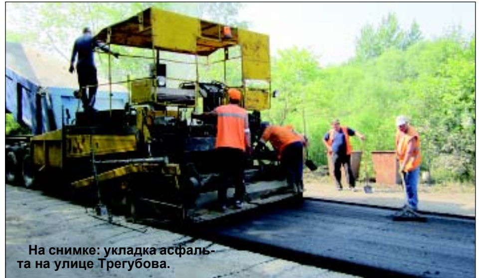
На снимке: укладка асфальта на улице Трегубова.