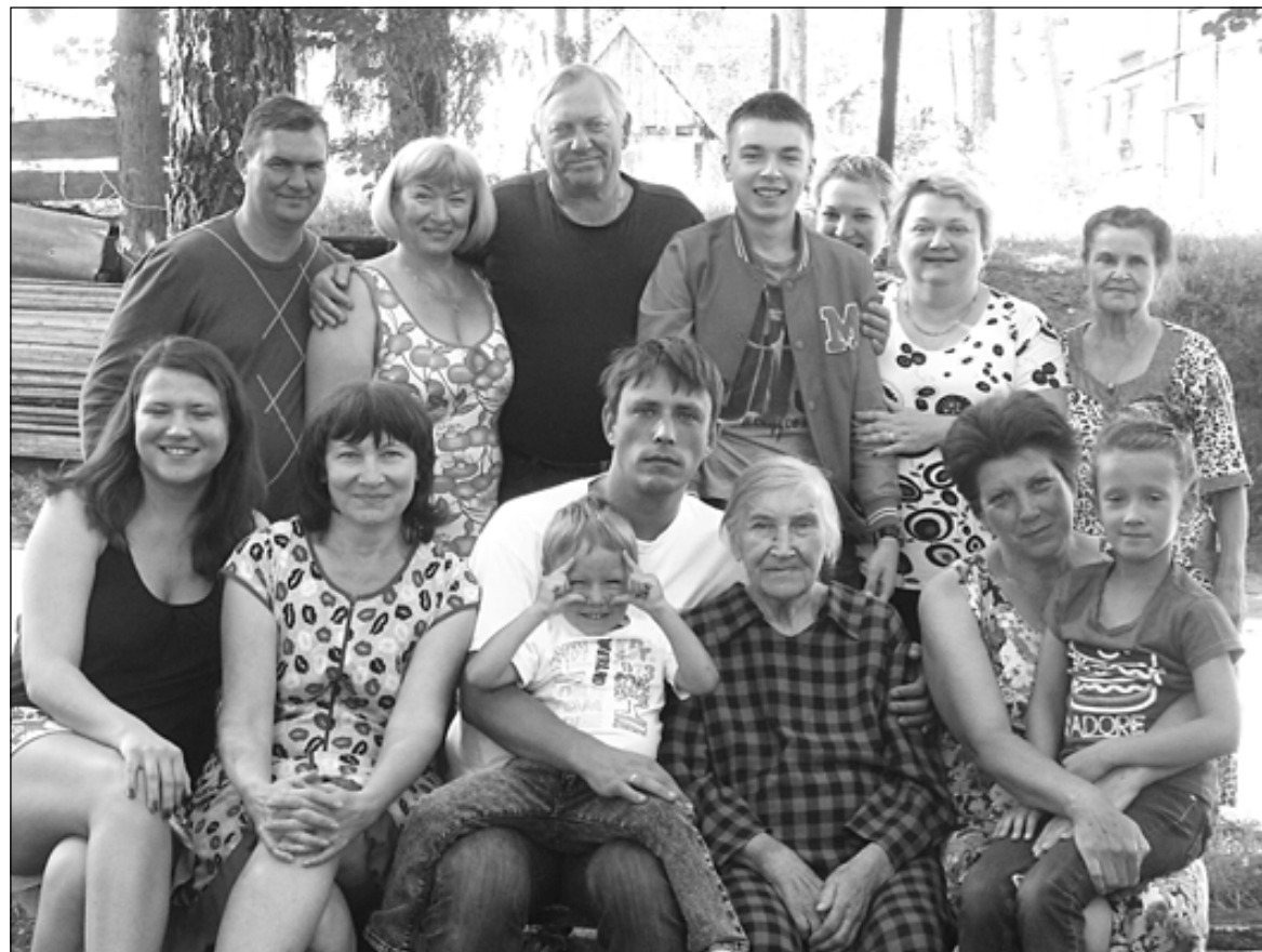
Юбилей в кругу родных.