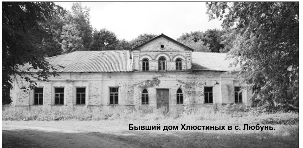
Бывший дом Хлюстиных в с. Любунь.